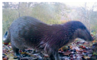
Au printemps 2023, un piège photo a immortalisé une loutre près du Boulou, un ruisseau.

5 avril 18h30 , à Périgueux: Conférence Gérer les forêts à l'heure du changement climatique: le travail en question