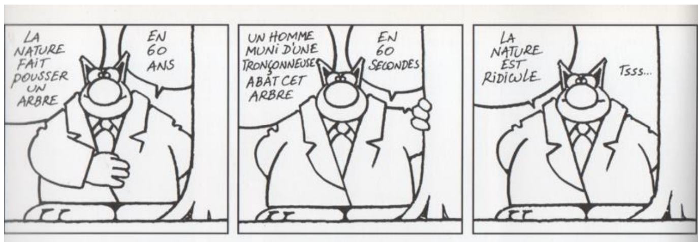
dessins de P. Geluck